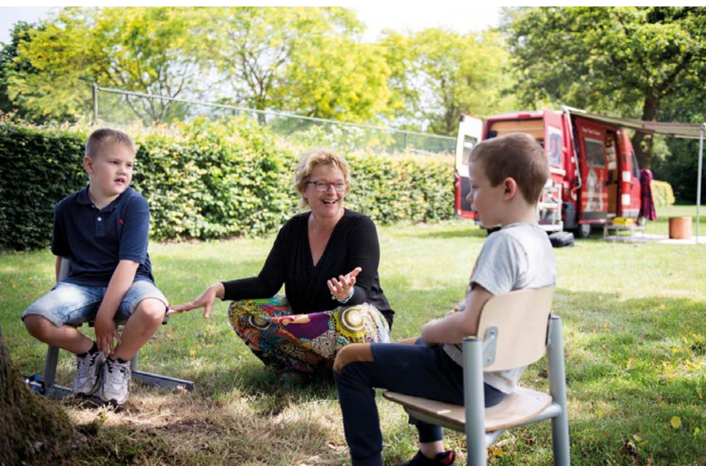
De Widdonckschool breidde het aanbod workshops uit met theaterles.